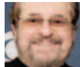
Phil Ramone , le producteur de musique qui a créé des succès avec Billy Joel et Paul Simon, recevra le Howie Richmond Hitmaker Award lors de la cérémonie de remise des Songwriters Hall of Fame Awards le 17 juin à New York.

Exposition / « Parallelepiped » au M museum de Louvain